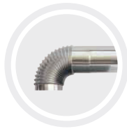
Ducto de evacuación de gases